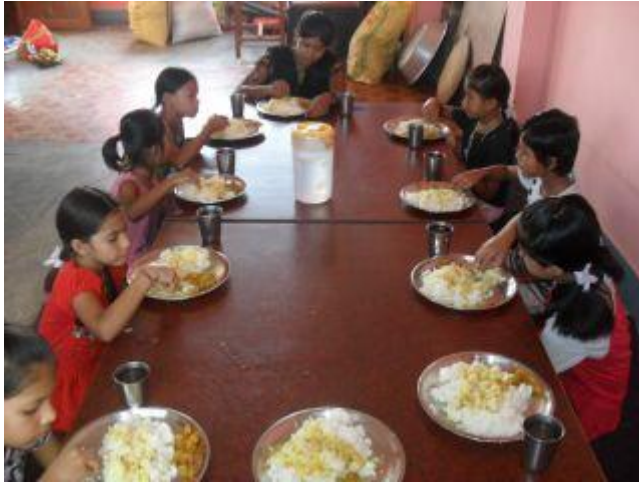
Dahl baat, den stora middagen på förmiddagen innan skolan börjar kl 10.00.