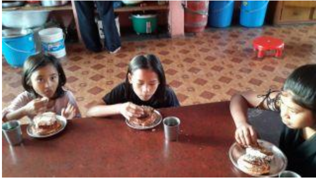
Särskild högtidsmat under Dashain.

Under Dashain är man ledig från skolan under några veckor, men nu har skolan återigen börjat.